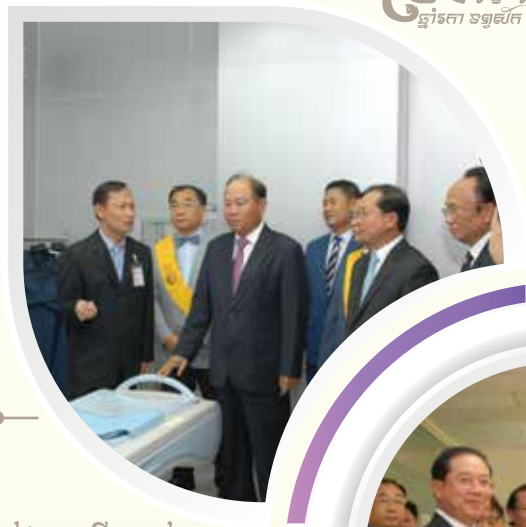
ពិធីសម្ពោធជាតិខ្មែរ ម៉េរីប្រាស់ ជាដួងការម៉ាស៊ីន CT ស្តែននៃ ទំនើបថ្មី និង ឧបករណ៍ វេជ្ជសាស្ត្រជាច្រើនទៀត!