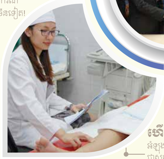
ហើមដើង អំឡុងពេលមានផ្ទៃពោះ ជាសញ្ញាអាសន្នទីទេ?